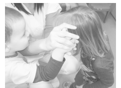
Locsolódás egy kis segítséggel