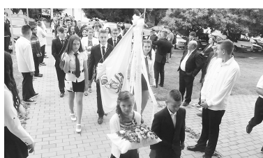
A tanév végén elballagtak a nyolcadikosok

Minden tanév végén a végzősök ballagása jelenti a legnagyobb iskolai eseményt a városban.