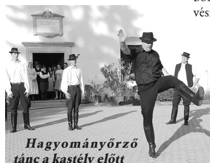
Hagyományörző tánc a kastély előtt

Bábszínház, az Idősek Klubjának énekkara, s a helyi Református kórus. Nagy sikert aratott a mazzszalkai Szatmár- és a nagyecsedai Rákóczi Kovács Gusztáv néptáncgyűjtés. Kiállítás nyílt Lakatos Tibor nyíregyházi képzőművész alkotásaiból, s hangversenyt adott Mándi Ákos zongoraművész. A program legjobban várt eseménye a Szent Iván-éji tűzgrás volt a Szatmár néptáncgyűjtés közreműködésével.