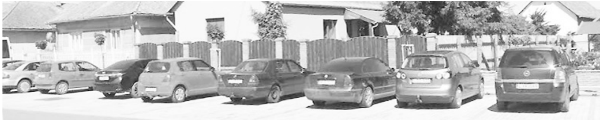
Nagy szükség volt a városközpontban, szemben a polgármesteri hivattal új parkolóhelyek kiépítésére. Mint képeink is bizonyítják, itt szinte mindig teltház van.

VAJA VÁROS ÖNKORMÁNYZATÁNAK ÉS LAKOSSÁGÁNAK LAPJA · XXIV. ÉVFOLYAM 3. SZÁM · 2017. MÁJUS – JÚNIUS