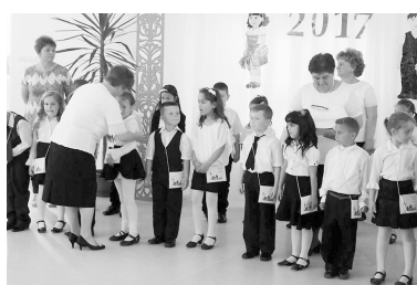
Az elmaradhatatlan tarisznyával engedték útnak a ballagó óvodásokat

Május 25-én, az óvodai évzáró ünnepség keretében tartották a nagycsoportosok ballagását. A Katica és a Süni csoportból kinőtt gyermekek abban az iskolában kezdik meg ősszel tanulmányaikat, ahonnan most búcsúztak el a nyolcadikosok.