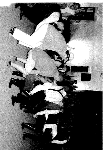
Férfiánc a kastélyparkban

Ahogy kezdet leszállni az este, úgy emelkedett a hangulat Nagy sikert aratott nagycesedi Rákóczi Kovács Gusztáv Hagyományörző Néptánc-együttes, a Vajai Idősek Klubja énekara és a mátszalkai Szat-