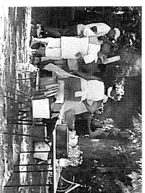
Tanácskozás a faszék körül

Jól sikerült a romanap, amit a vajai roma nemzetiségi kisebbségi önkormányzat rendezett a kéziabada pályán szeptember 10-én. A szervezők kitértek magukért, hiszen a gazdag músor mellett izletes falatok is várták az érdeklődőket.